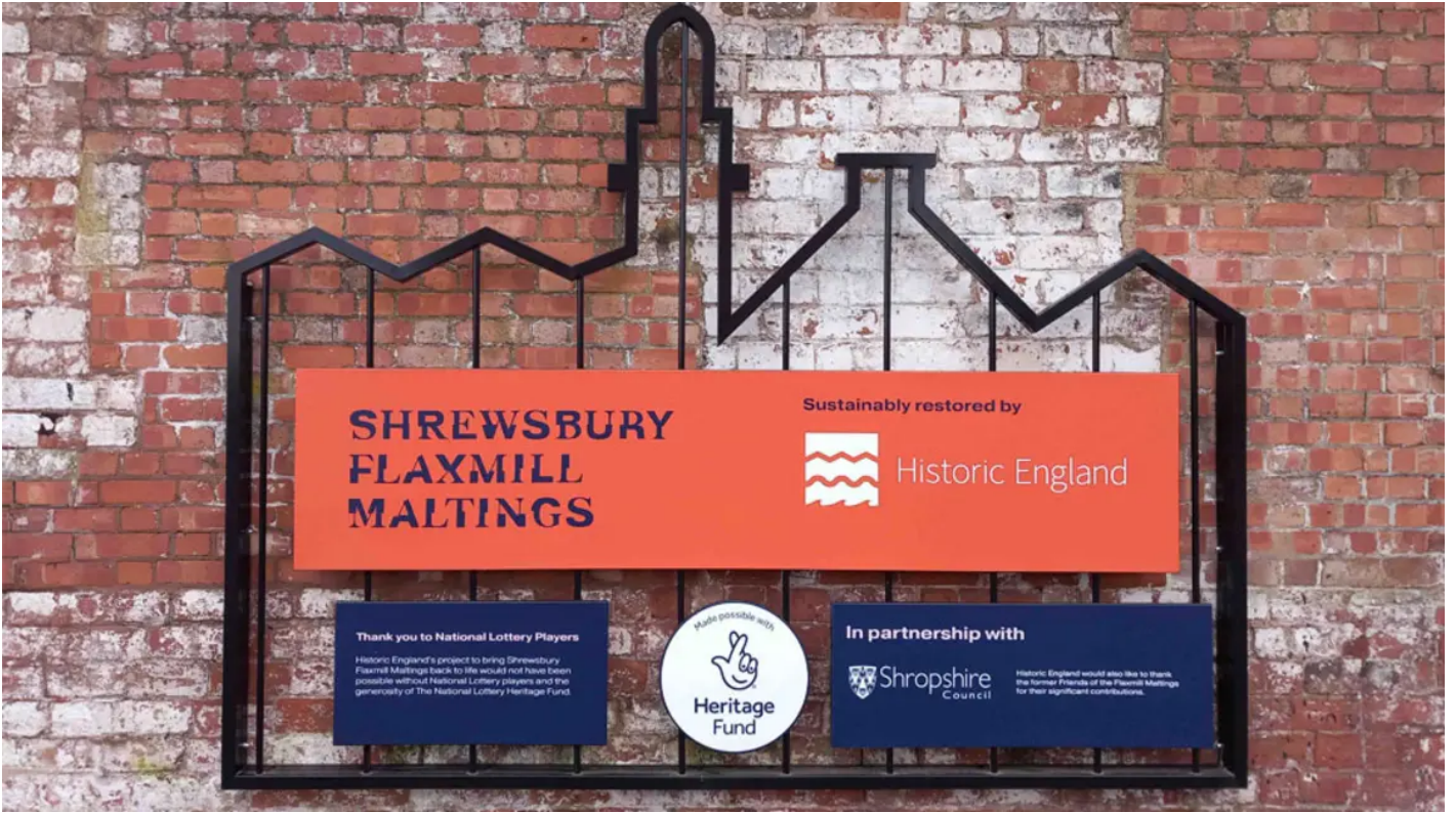
Funders board at Shrewsbury Flaxmill Maltings