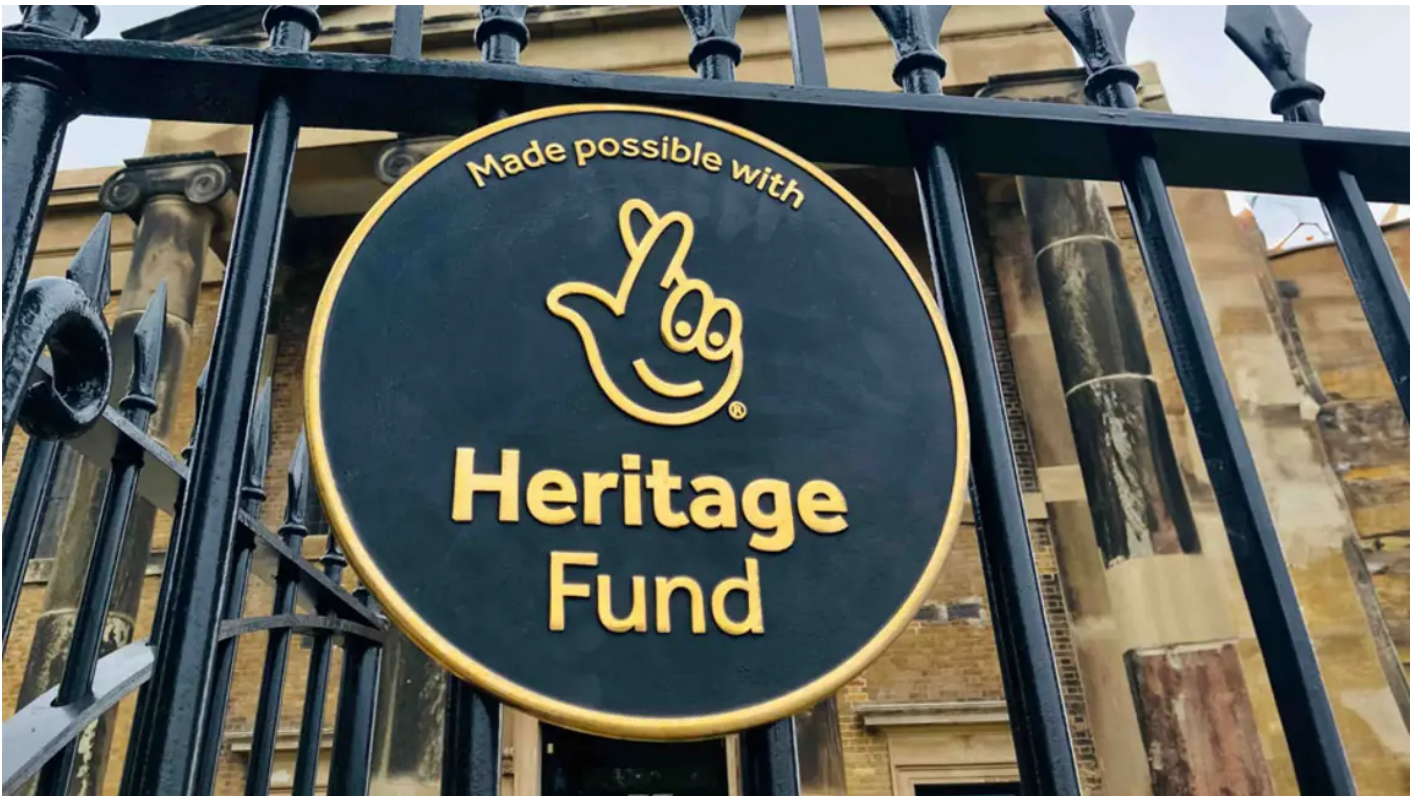
Acknowledgement plaque at Sheerness Dockyard.