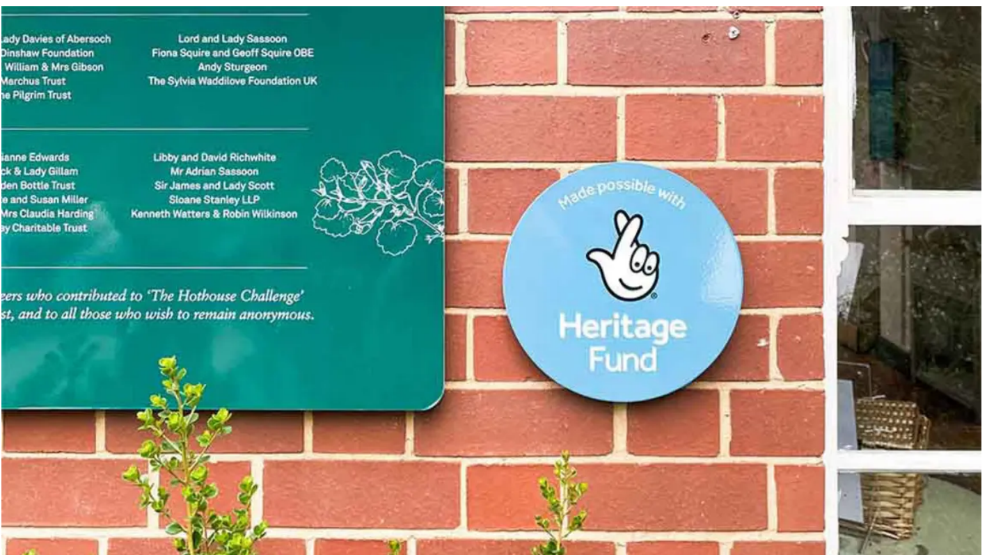
Acknowledgement stamp on display at Chelsea Physic Garden.