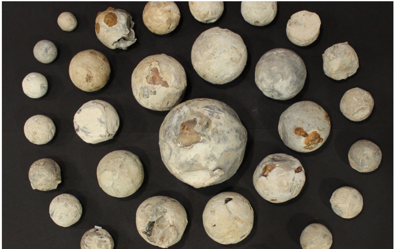
Cannonballs a geir ar safle'r frwydr

Cefnogodd ein hariannu ymchwiliad i leoli a nodweddu maes brwydr Bosworth ym 1485 lle lladdwyd y Brenin Rhisiart III a diweddarau arddangosfa Canolfan Dreftadaeth Maes y Gad. Daeth y prosiect â thîm o haneswyr, gwyddonwyr, ysgolheigion, archeolegwyr a gwirfoddolwyr ynghyd a gynhaliodd arolwg canfod metel, dadansoddi darganfyddiadau, ail-greu'r tir hanesyddol yn ddigidol ac ail-ddadansoddi ffynonellau sylfaenol y frwydr.