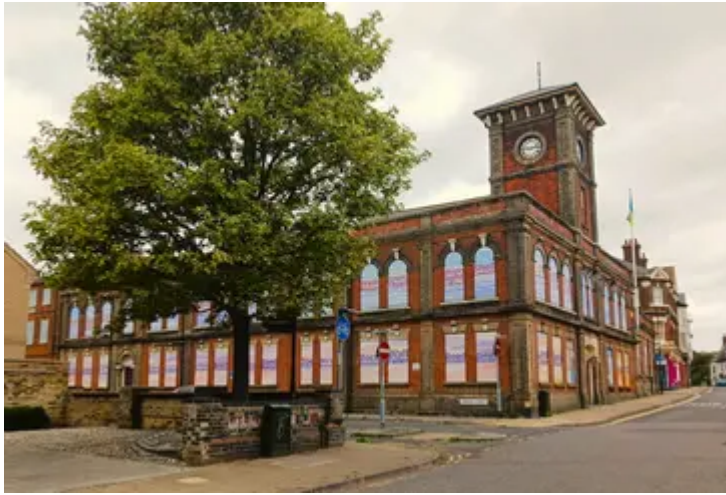
Neuadd y Dref Lowestoft, Suffolk

Mae'r adeilad 'mewn perygl' hwn ar fin dod yn Hyb Cymunedol Porth ffyniannus a chynaliadwy. Nod y prosiect, a fydd hefyd yn derbyn £1m o'r Gronfa Future High Streets trwy Gyngor Medway, yn adfywio treftadaeth yn Chatham am genedlaethau i ddod.