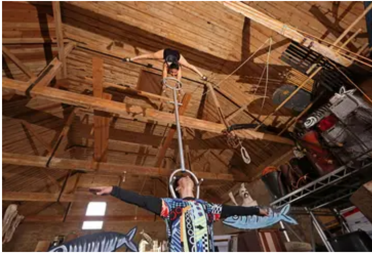
Duo Vita Circus yn perfformio yn y T? Iâ yn Great Yarmouth