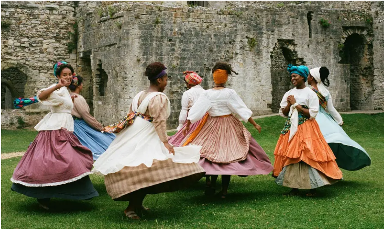
Castell Porchester, Hampshire © Sadé Elufowoju/National Youth Theatre.