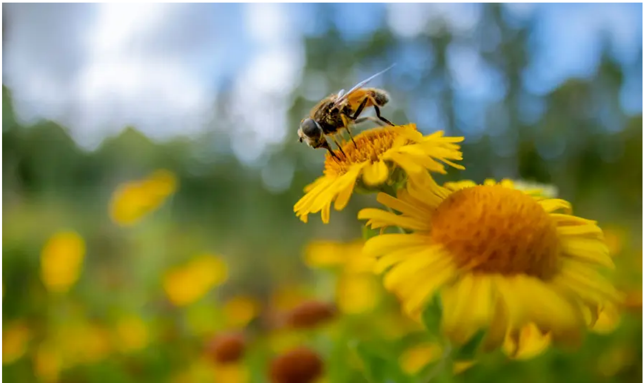
Ffugwenynen, Gwlad yr Haf

"Datblygwyd Treftadaeth 2033 gyda'ch mewnbwn chi, ac edrychwn ymlaen at gydweithio â chi i gyflwyno ein gweledigaeth ar y cyd ar gyfer treftadaeth dros y blynyddoedd i ddod."