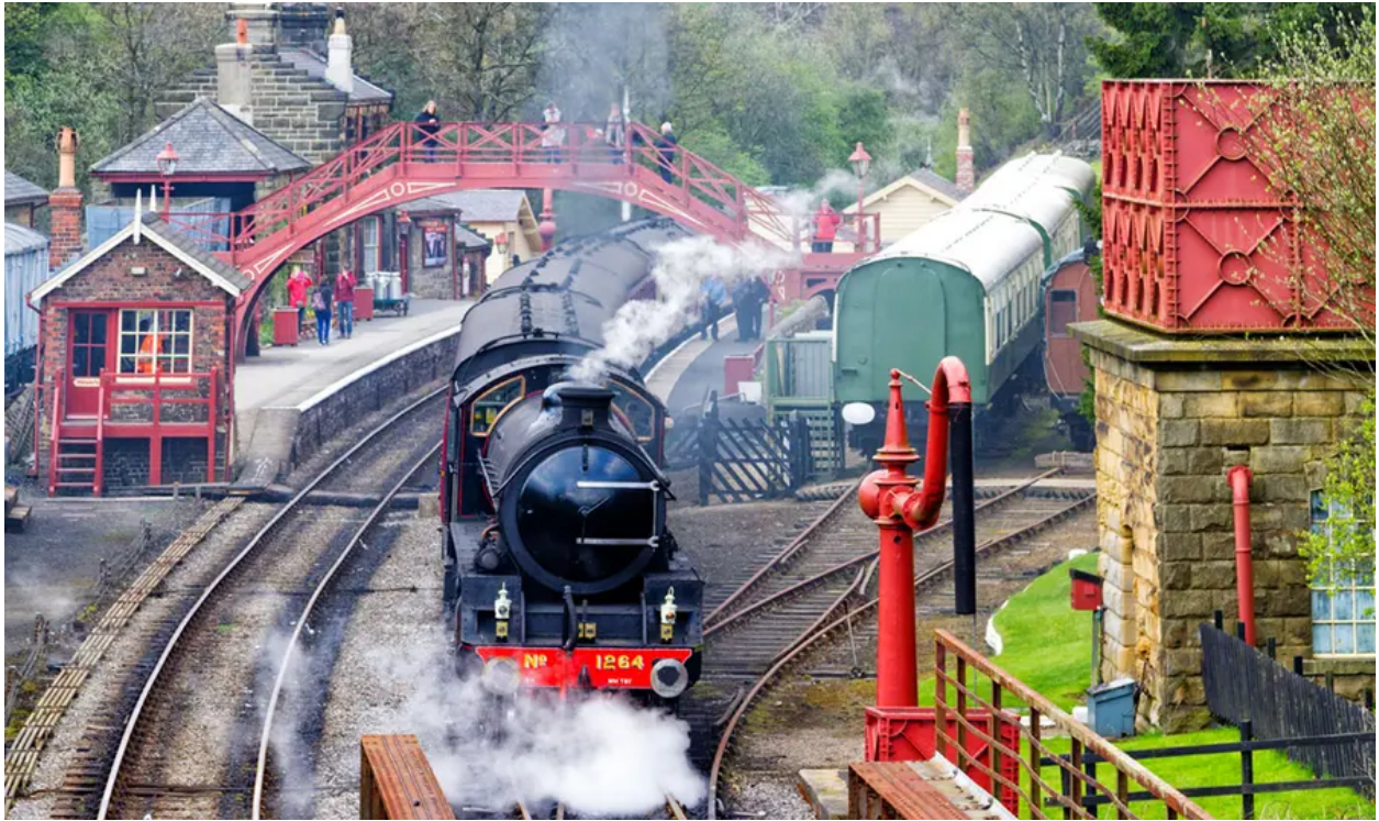
North York Moors Railway