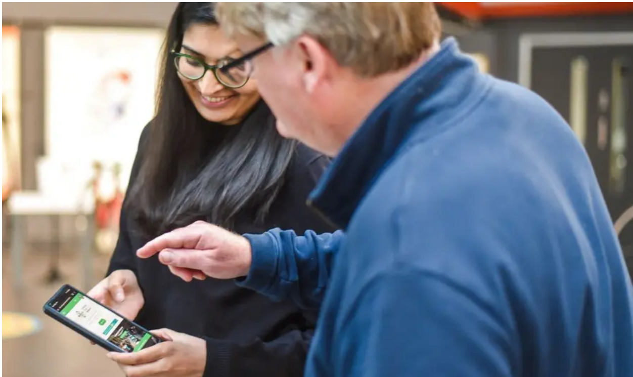
Menyw ifanc yn rhannu ei sgiliau digidol.

Mae ei aelodaeth o 730 yn adlewyrchu'r gwaith allgymorth hwnnw yn gynyddol. Mae'n rhychwantu sefydliadau treftadaeth traddodiadol, grwpiau cymunedol a chelfyddydau sy'n defnyddio safleoedd hanesyddol, yn ogystal â'r rhai sy'n gofalu am gamlesi a gerddi. Mae hefyd yn cyfrif dros 160 o fyfyrwyr ymhlith ei aelodau.