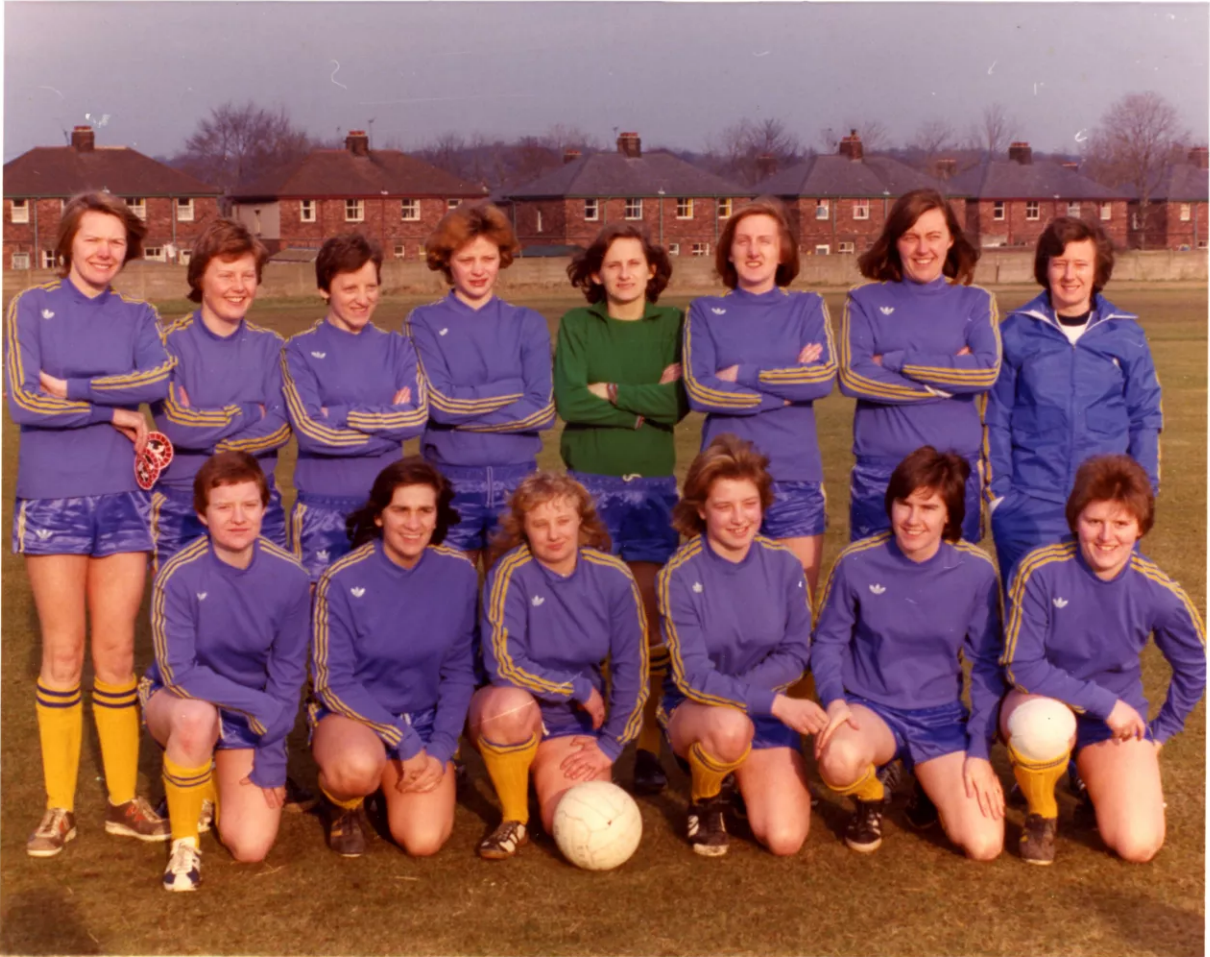
Clwb Pêl-droed St Helens, 1977. Mae haf cyffrous o ddathliadau, arddangosfeydd, ffilmiau cof a gweithgareddau cymunedol yn cael ei gynnal ar draws naw dinas letyol EURO Menywod UEFA fel rhan o brosiect EURO Menywod UEFA 2022 – Prosiect Treftadaeth Pêl-droed Menywod.