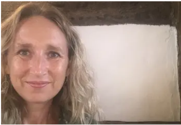
cybr at lwyddiant digidol