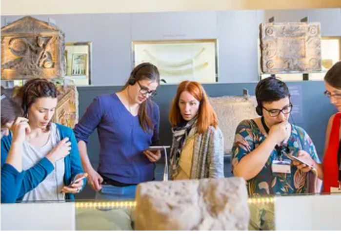
At the Hunterian Museum Credit: The Hunterian 364