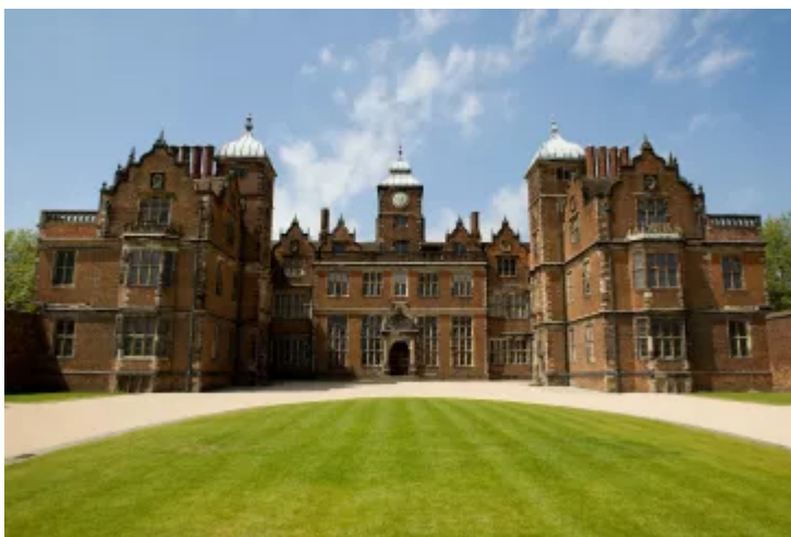
Neuadd Aston yn Birmingham