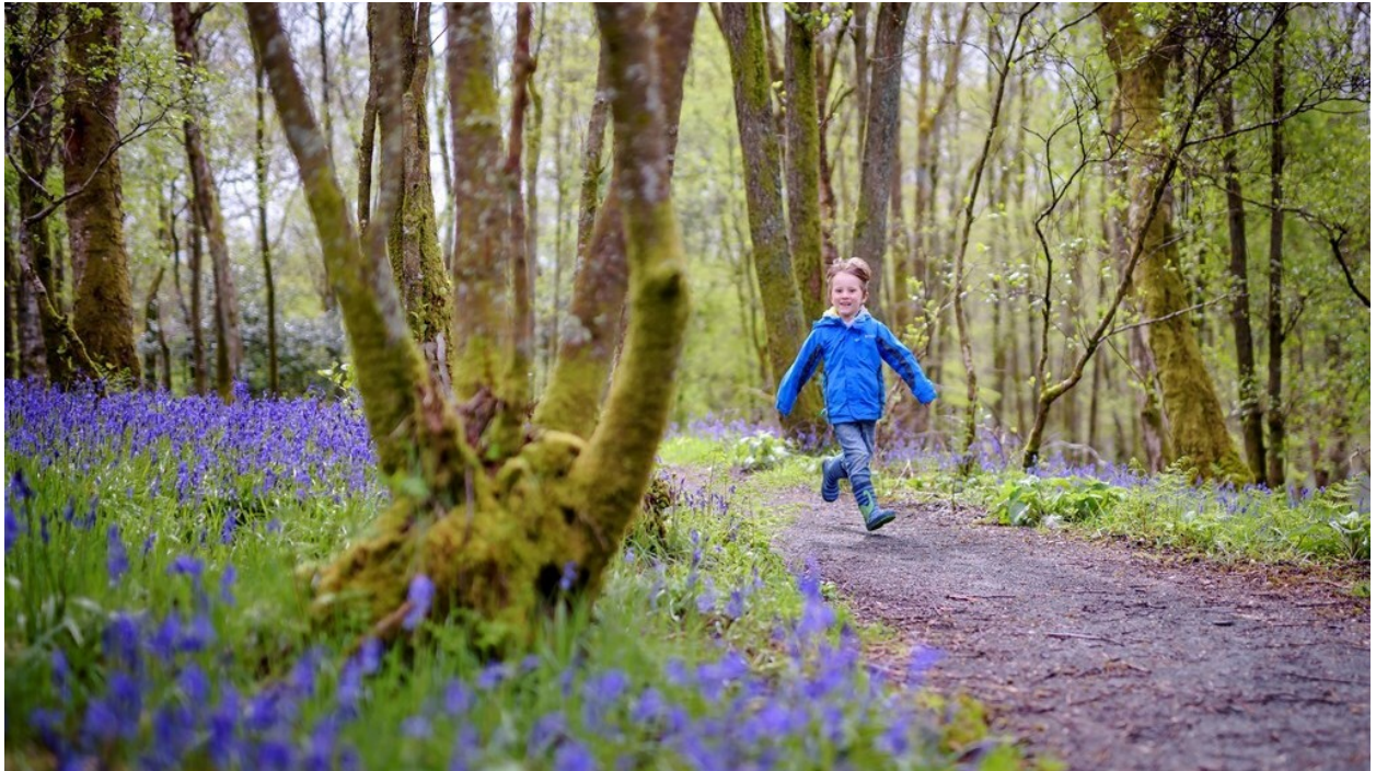
Archwilio natur yn RSPB Loch Leven.