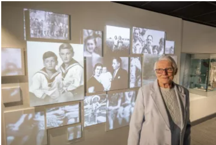
Cadw'r gorffennol yn Arddangosfa'r Holocaust a Chanolfan Ddysgu, Huddersfield

Bydd y ganolfan yn cyflwyno rhai o'i chasgliadau mwyaf prin ar gyfer chwaraewyr y Loteri Genedlaethol. Ewch draw i gwrrd â'r archifydd a darganfod beth mae'n ei olygu i ddiogelu treftadaeth yr Holocaust.