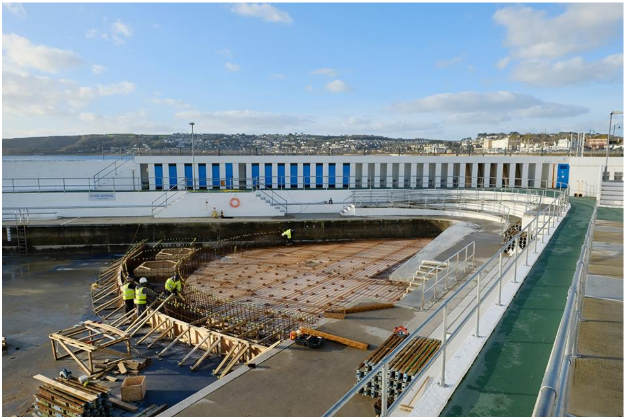
Pwll jiwbilî yn cael ei adeiladu

Hefyd, roedd pobl yn aml yn cael trafferth gyda thymheredd y dŵr oer. Er mwyn cefnogi twf economaidd hirdymor, bu'n rhaid i'r pwll fod ar agor fwy na phedwar mis y flwyddyn a pheidio â bod mor ddibynnol ar y tywydd.