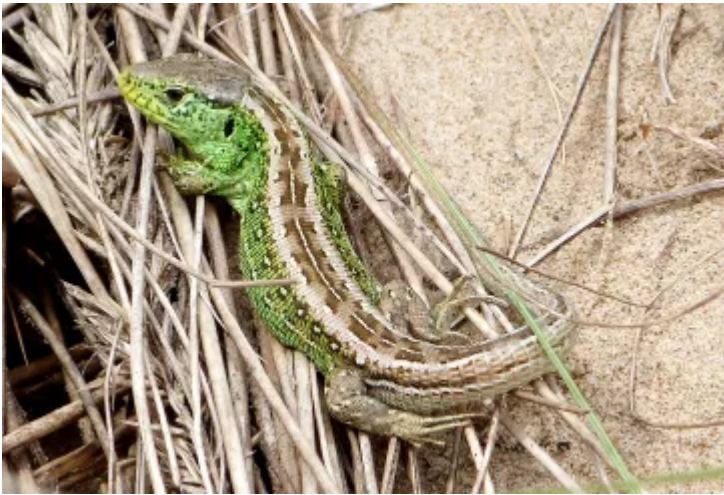
Madfall y twyni.

Mae'r madfallod hyn sydd mewn perygl yn byw ar dwyni tywod sydd wedi'u rhestru fel y cynefin sydd fwyaf mewn perygl yn Ewrop.