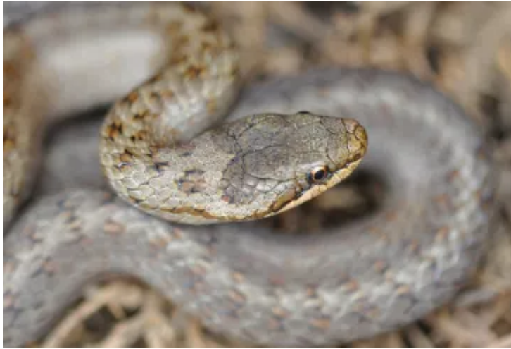
Neidr lefn.

Mae pob rhywogaeth yn chwarae rhan bwysig yn yr ecosystem naturiol, boed hynny'n peillio ein cnydau bwyd, yn lleihau llifogydd neu'n dadelfennu ac ailgylchu ein gwastraff.