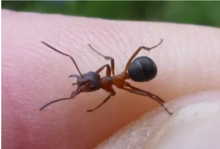
Morgrugyn cul.

weinyddir gan y Gronfa Treftadaeth), yn helpu'r rhywogaeth hon i oroesi.