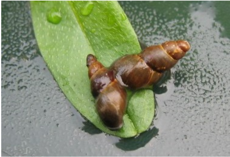
Dau falwod pwll mwd.

Mae gan falwen pwll mwd cragen brown sy'n tyfu'n fwy na hyd gewin bysedd. Ar un adeg roedd y falwen yn gyffredin, ond bellach mae'r niferoedd wedi gostwng bron i 50% ar draws ei hamrywiaeth yn y DU yn ystod y 25 mlynedd diwethaf.