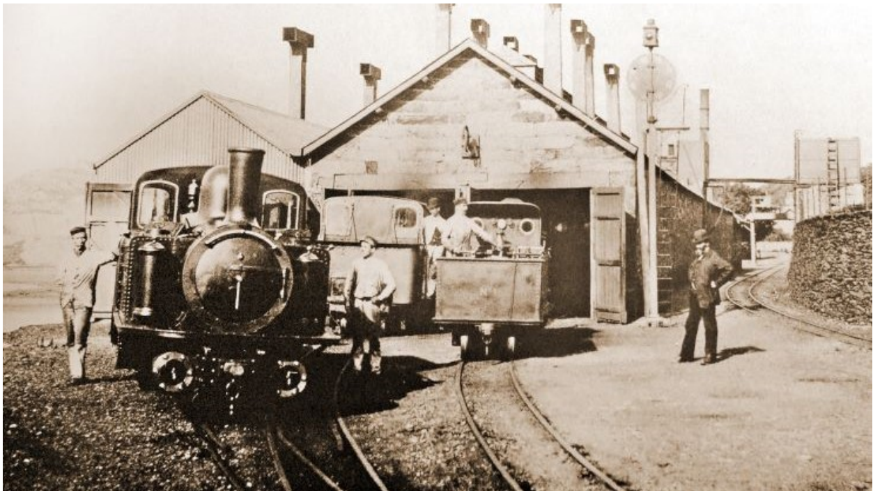
Sied Gwaith Boston Lodge yn 1887

"Yn ogystal â'r manteision economaidd a chyflogaeth niferus o Reilffyrdd Ffestiniog a Chymru, mae'r prosiect hwn sy'n canolbwyntio ar waith Boston Lodge yn enghraifft wych o sut y gall treftadaeth ein helpu i ddeall pwy ydym ni ac o ble rydym yn dod a sut mae'r cymunedau yr ydym yn rhan ohonynt wedi'u llunio gan y gorffennol drwy ddod â hanes yn fyw."