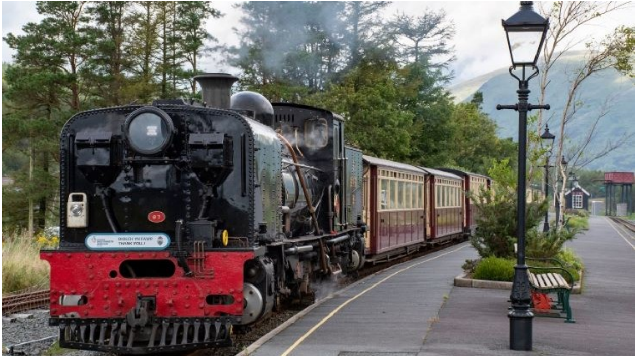
Trên Rheilffyrdd Ffestiniog / Ucheldir Cymru mewn gorsaf.