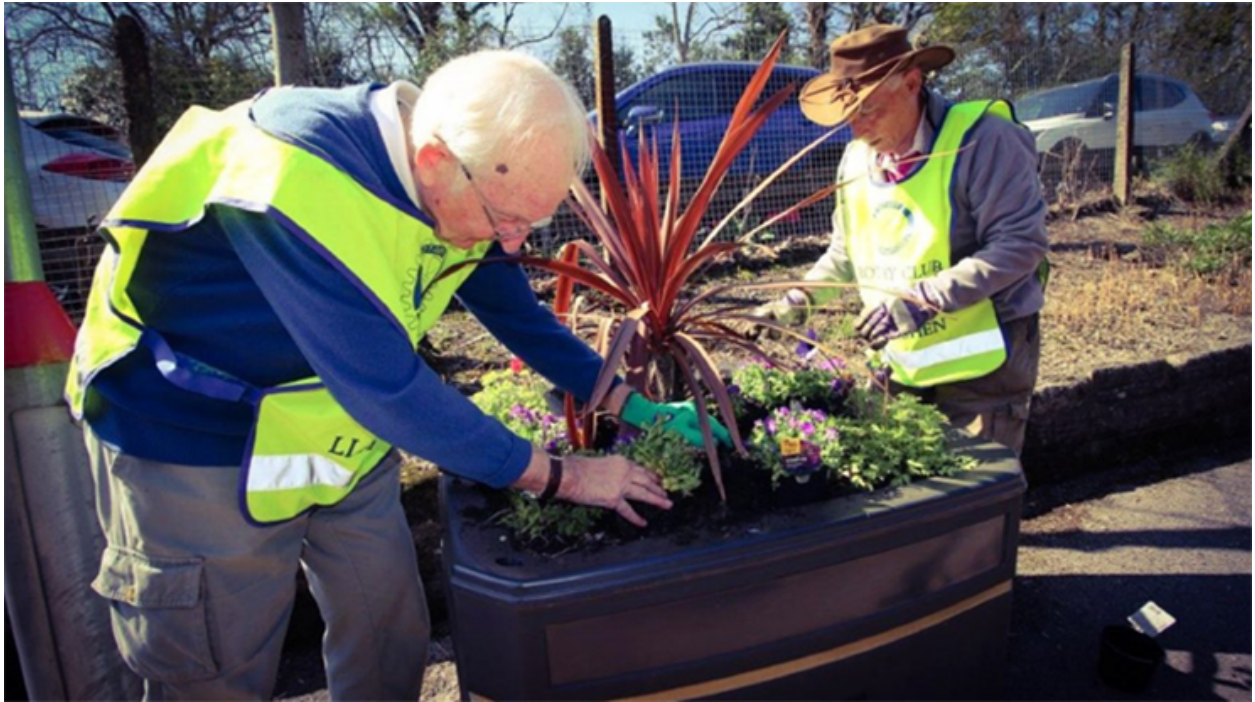
Gwirfoddolwyr yn plannu blodau mewn gorsaf drenau yng Nghymru