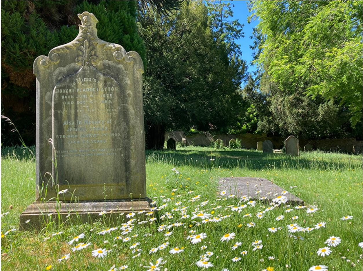
Bedd wedi'i amgylchynu gan lygaid y dydd ym Mynwent Rectory Lane

Creodd y grantodd goridor bywyd gwyllt a oedd yn rhoi hwb i fywyd gwyllt lleol. Roeddent hefyd yn lleihau eu defnydd o ynni, yn defnyddio cyflenwyr cynaliadwy lleol ac yn hyrwyddo arferion cynaliadwy i'w hymwelwyr.