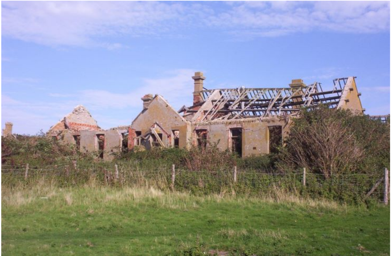
Hen ysbyty colera ynys Echni