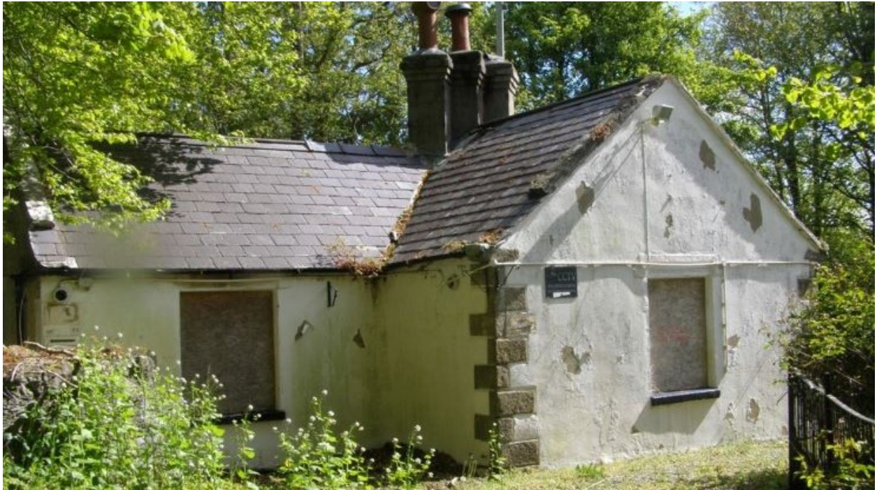
Bwthyn y Marcwis