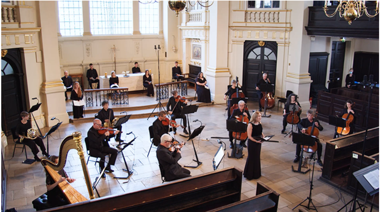
Cyngerdd yn St-Martin-in-the-Fields, Llundain

"Mae'r adroddiad yma'n rhoi cipolwg allweddol ar sut yr effeithiwyd ar dreftadaeth yn ogystal â sut y gallwn ni fel corff ariannu barhau i'w helpu i arloesi ac addasu wrth symud ymlaen."