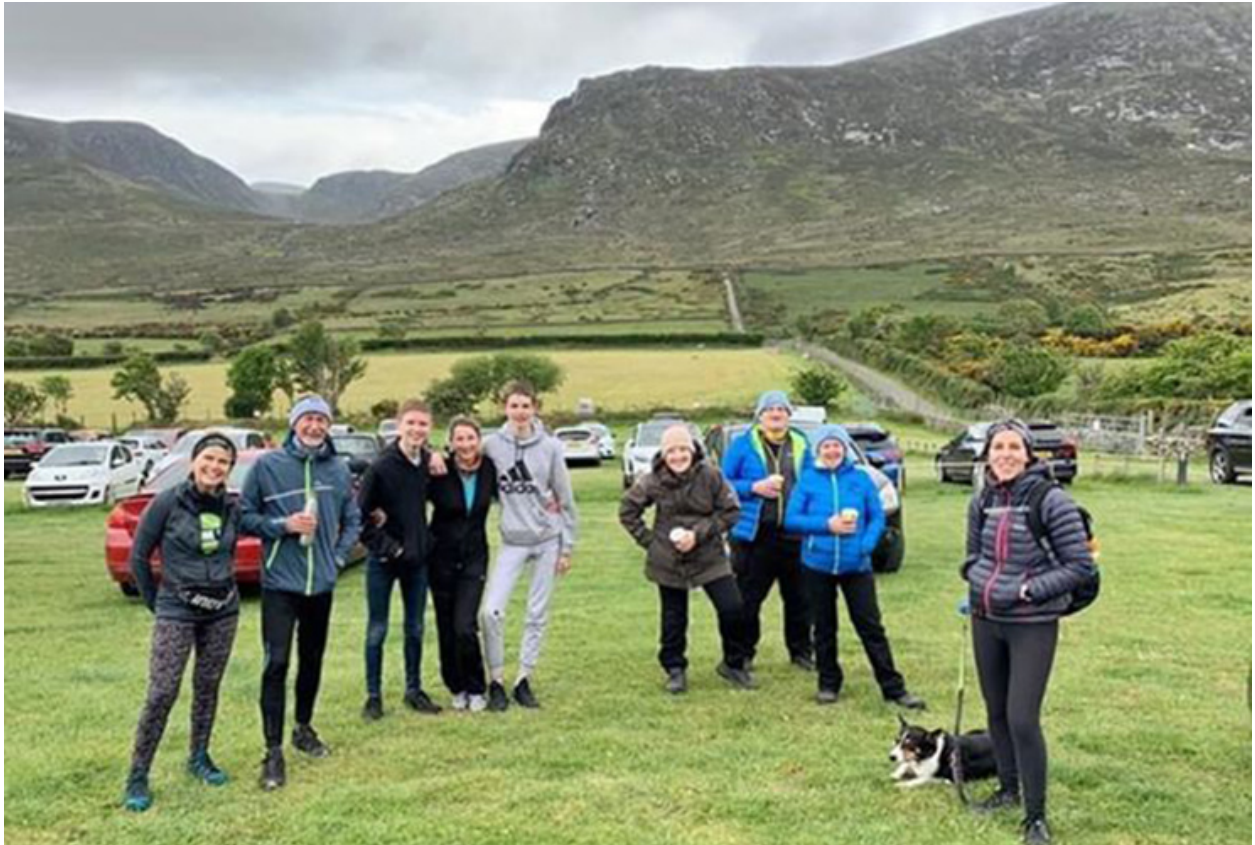
Gwirfoddolwyr treftadaeth Mourne

Dywedodd dros ddwy ran o dair o'r ymatebwyr eu bod yn gwario o leiaf rhywfaint o'u grant ar fesurau ymbellhau cymdeithasol. Helpodd hyn lawer o sefydliadau treftadaeth i ailagor yn ddiogel, a gwirfoddolwyr i ddychwelyd i'w rolau.