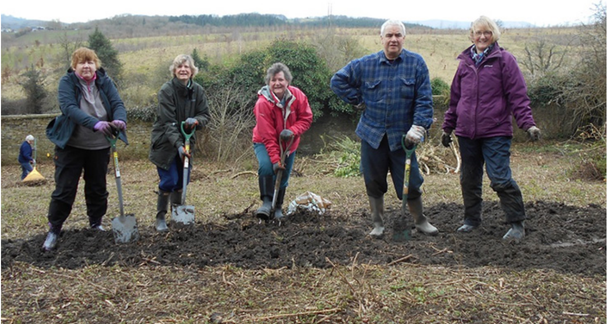
Gweithwyr yng Nghefn Ila, Sir Fynwy

Mae cydnerthedd sefydliadol yn gallu ymateb i newidiadau, bygythiadau a chyfleoedd. Mae'r adroddiad yn amlinellu'r ddwy agwedd allweddol ar wydnwch: