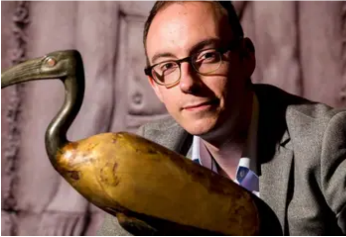
Eifftoleg dan gyfyngiadau symud