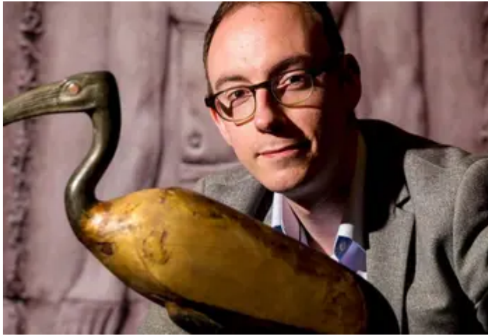
Eifftoleg dan gyfyngiadau symud