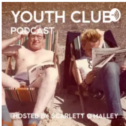
Podcast Youth Club

Mae Archifau'r Clybiau Ieuentid wedi casglu dros 100,000 o luniau o ddegawdau o ddiwylliant ieuentid y DU ac mae'n rhannu rhai o ganfyddiadau'r babanod mewn podlediad bob pythefnos . Yn y bennod gyntaf, mae'r gwesteiwr Scarlett O'Malley yn siarad â ffotograffydd Gavin. Maent yn ymchwilio i'w hunaniaeth ieuentid, ei amser fel astrologer a'i waith gyda'r cerddor a'r actor Plan B.