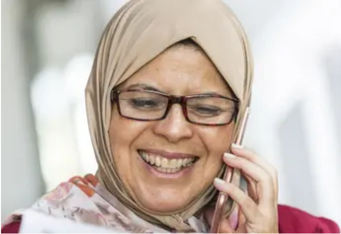
Sgyrsiau ffôn Neuadd Toyneeb

Mae Neuadd Toyneeb yn Nwyrain Llundain wedi cau eu canolfan ond wedi dechrau Gweithgareddau Activities Against Isolation ar Facebook, grŵp cymunedol ar-lein pwrpasol i unrhyw un sy'n poeni y byddant yn unig neu wedi'u diflasu yn ystod cyfnod ynysu. Gallwch hefyd gymryd rhan yn eu Gwasanaeth Phone Befriending Service , sy'n dwyn ynghyd bobl â diddordebau cyffredin ar gyfer sgwrs reolaidd dros y ffôn.