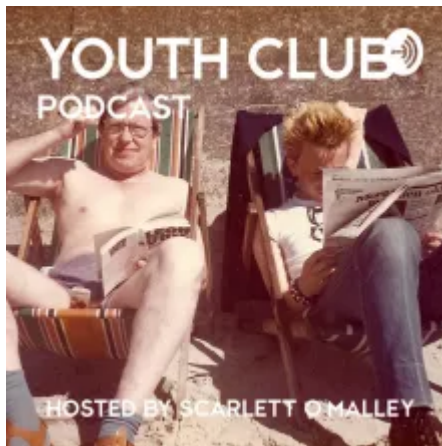
Podcast Youth Club