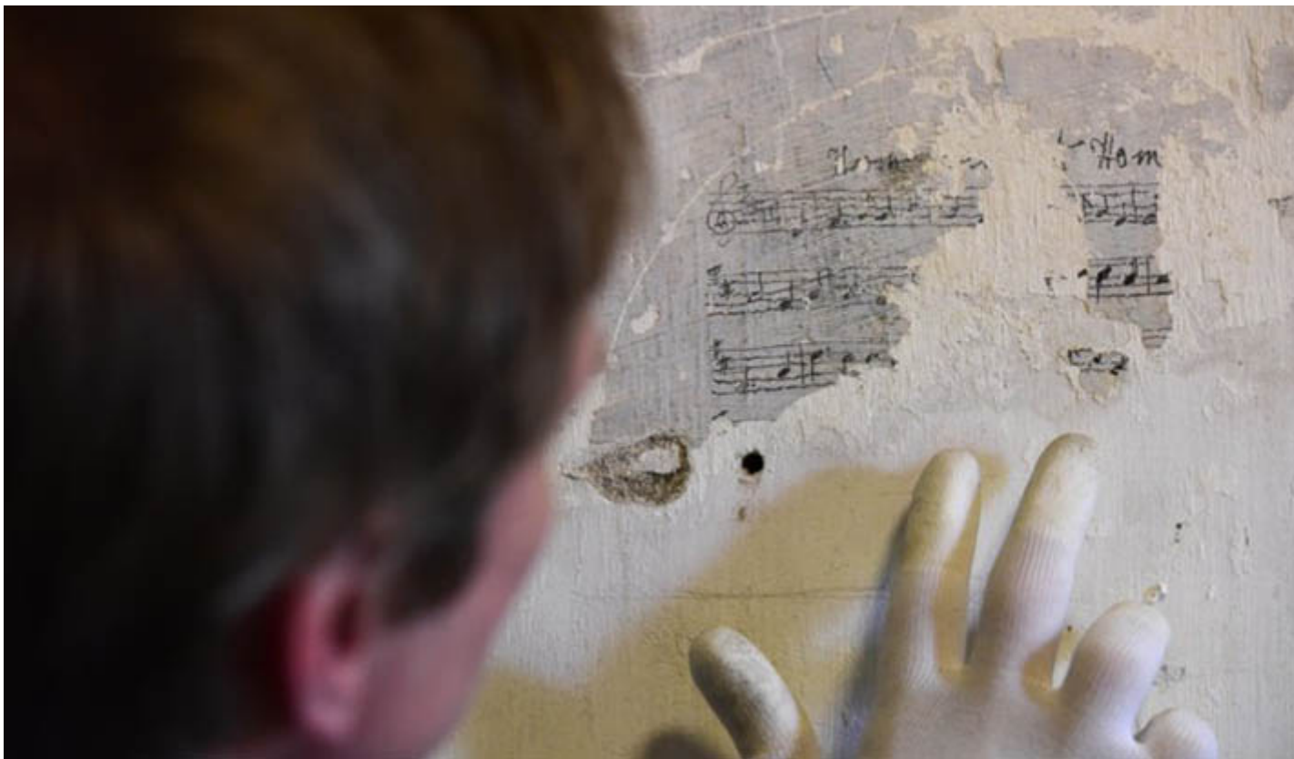
Cafodd prosiect sy'n gwarchod graffiti ym Mloc Cell Castell Richmond arian y Loteri Genedlaethol.

Gweler yr adroddiad am y rhestr lawn ar gyfer pob gwlad yn y DU.