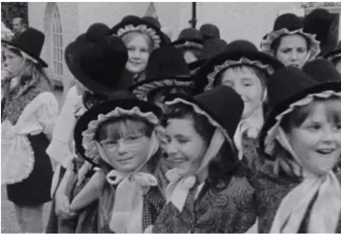
Tiger Bay burning bright

Hanes darlledu Cymru yn ddiogel ar gyfer y dyfodol