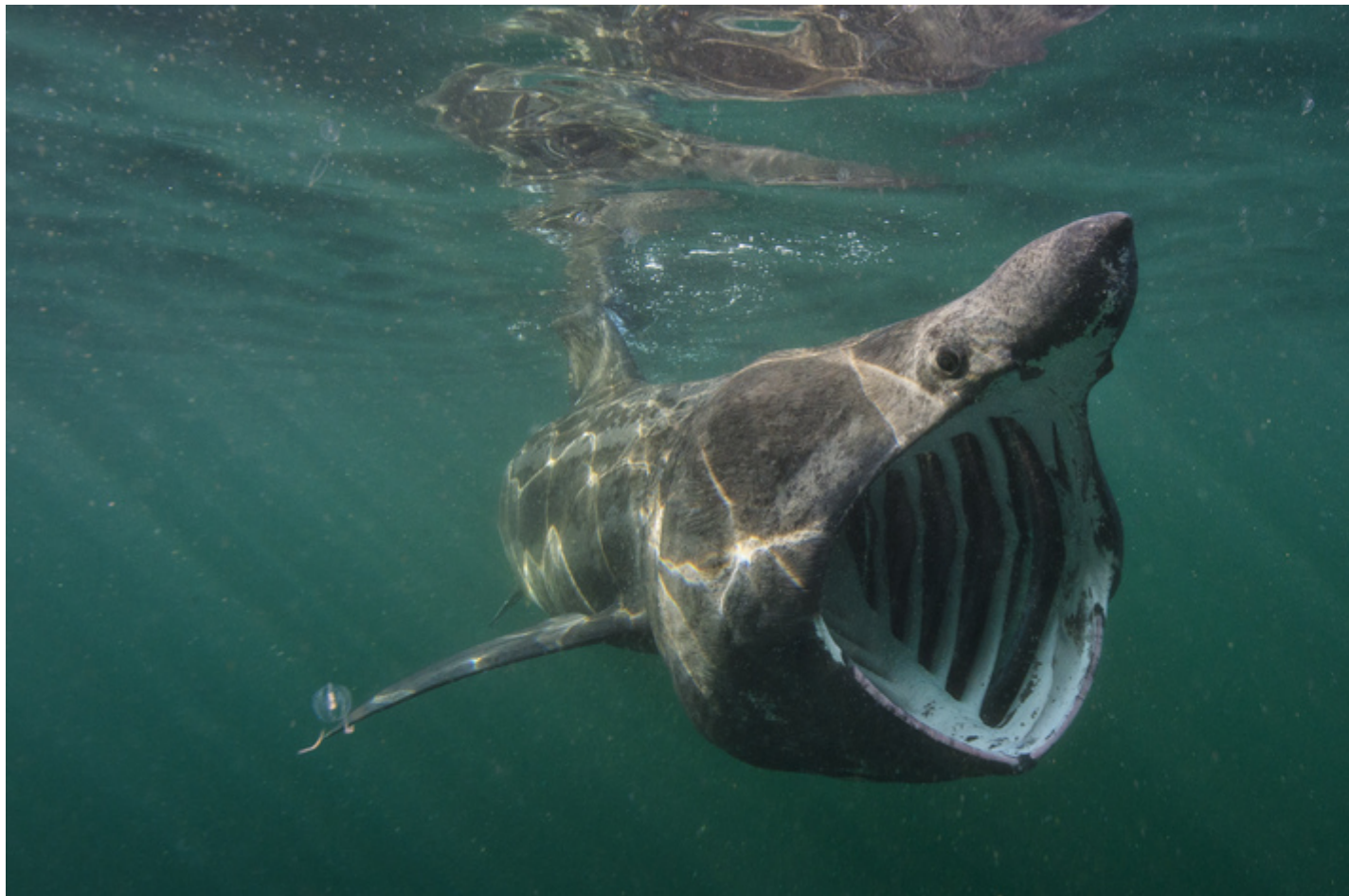
Heulforgi. Credyd: Alex Mustard