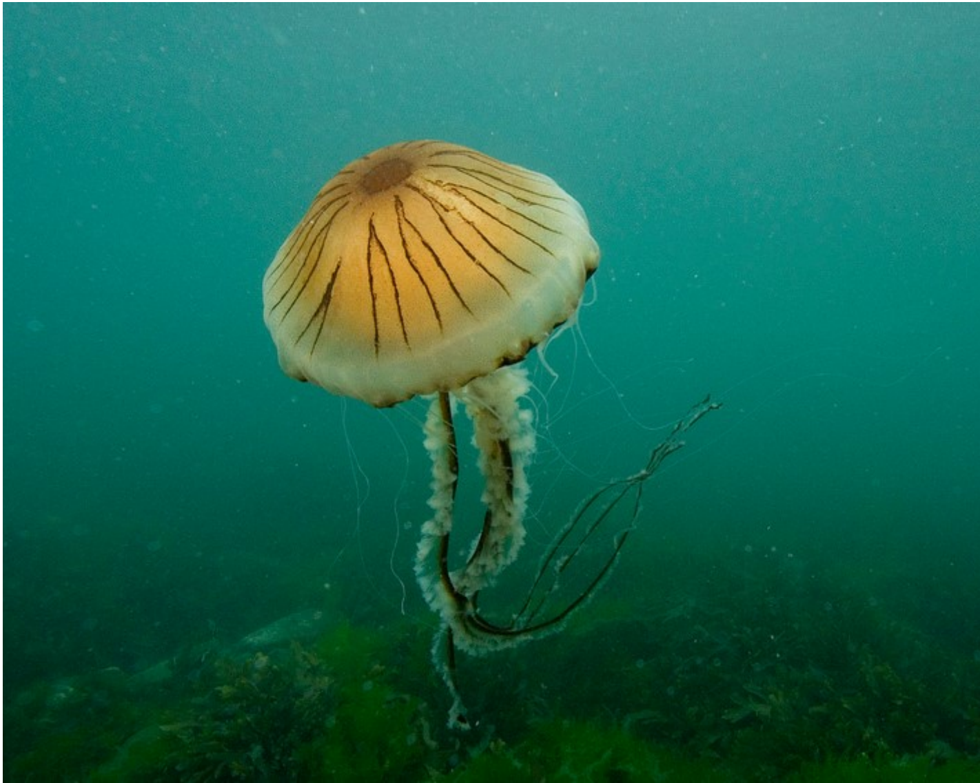
Sglefren Fôr Ddanhadlen. Credyd: Paul Naylor