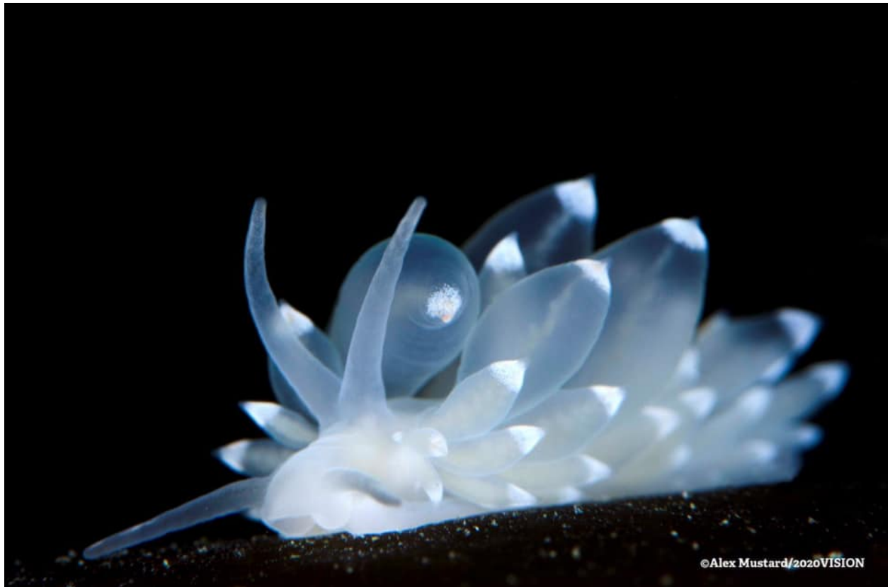
Nudibranch sea slug.