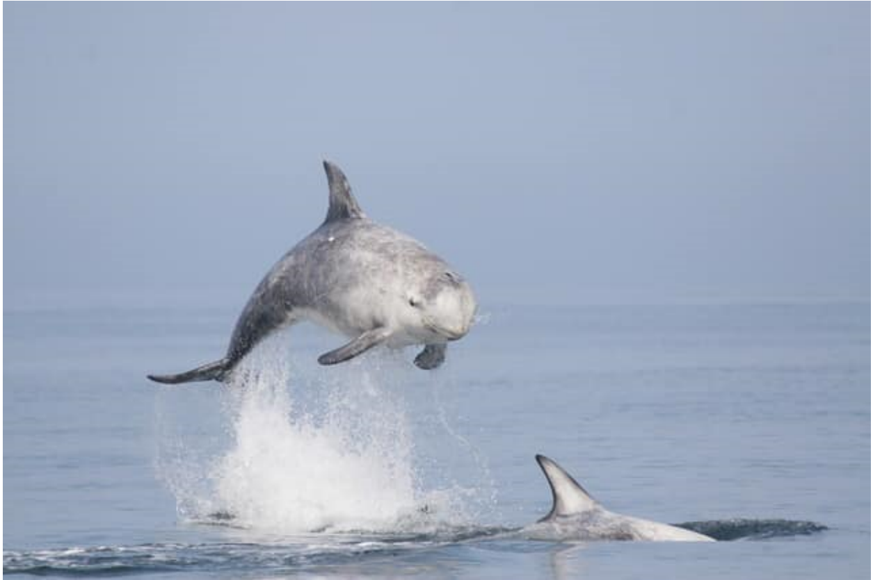
Dolffiniaid Risso.

Nid oes gan Ddolffiniaid Risso ddannedd yn eu gên uchaf ac maen nhw'n gallu llyncu ysglyfaeth gyfan.