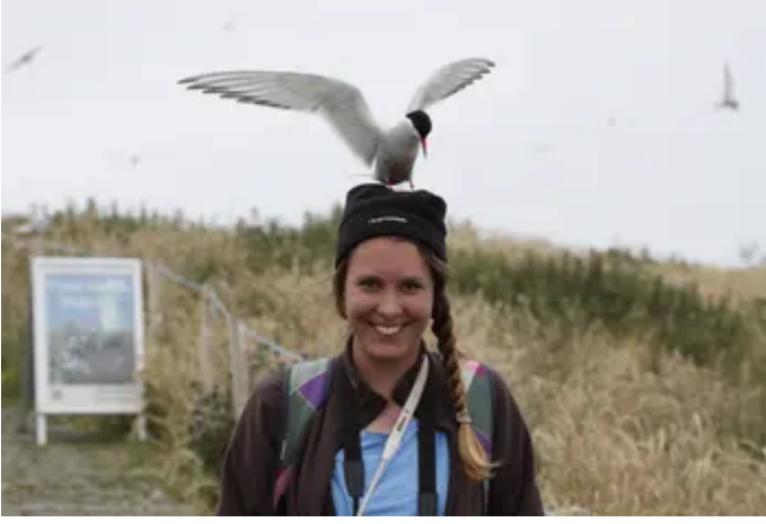
A Little tern says hello to a Coast Care volunteer Northumberland Coast AONB