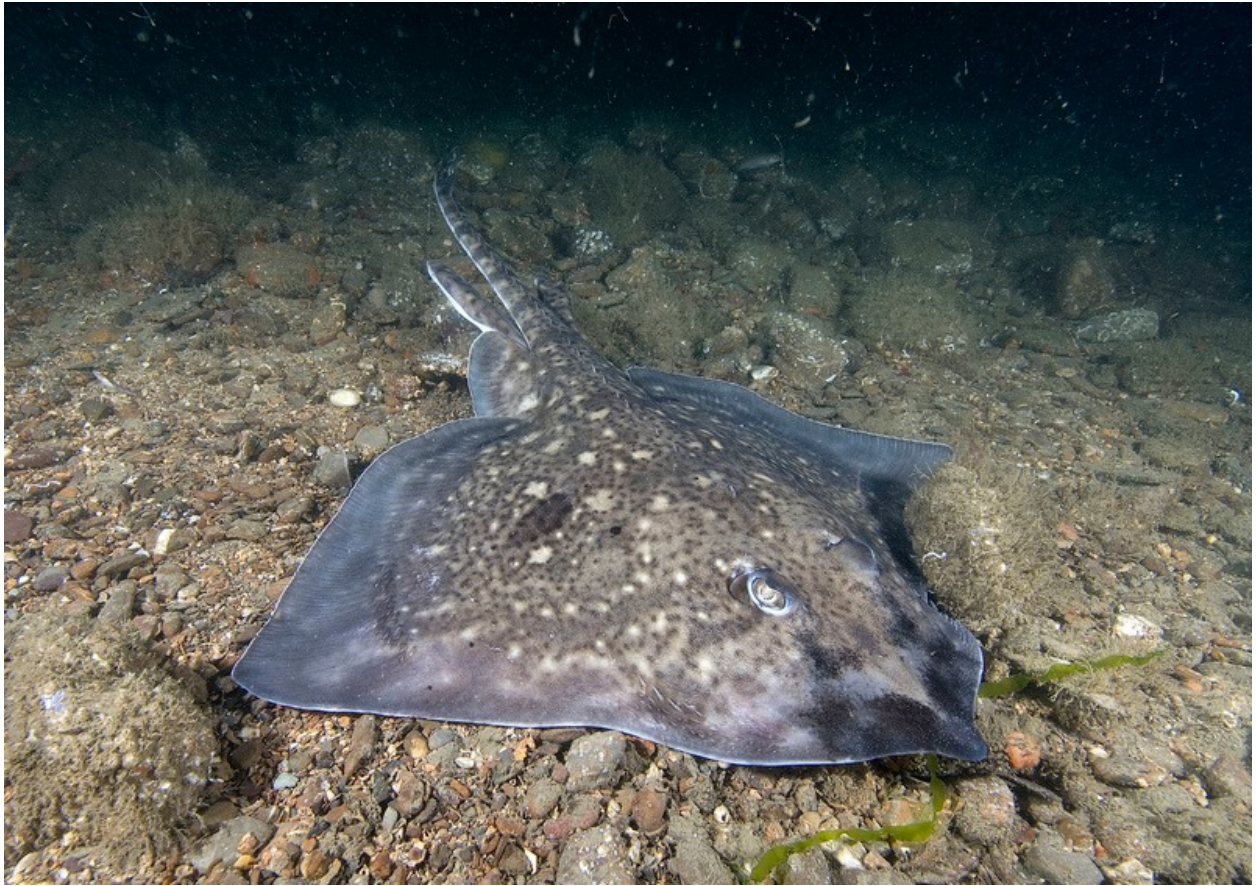
Thornback Ray.