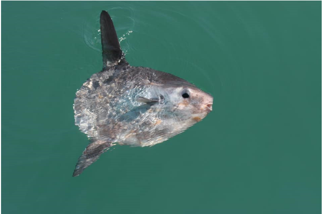
Pysgodyn yr Haul

Pysgodyn yr Haul yw pysgodyn bonedd mwyaf y byd, gan gyrraedd hyd at dri metr o hyd. Gellir eu gweld yn ystod misoedd yr haf yn 'torheulo' ar wyneb y môr.