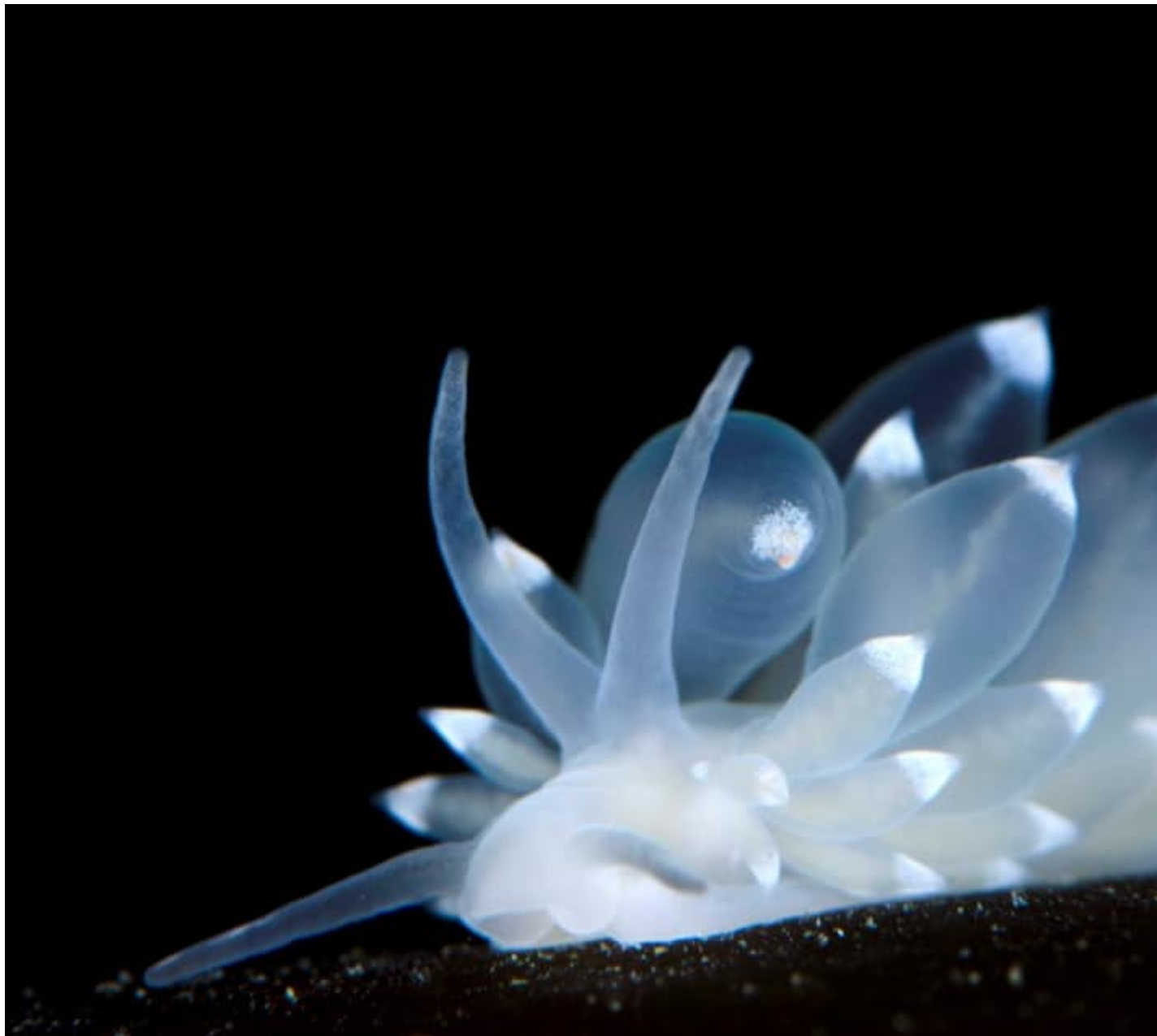
Nudibranch sea slug.