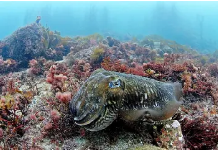
with National Lottery support