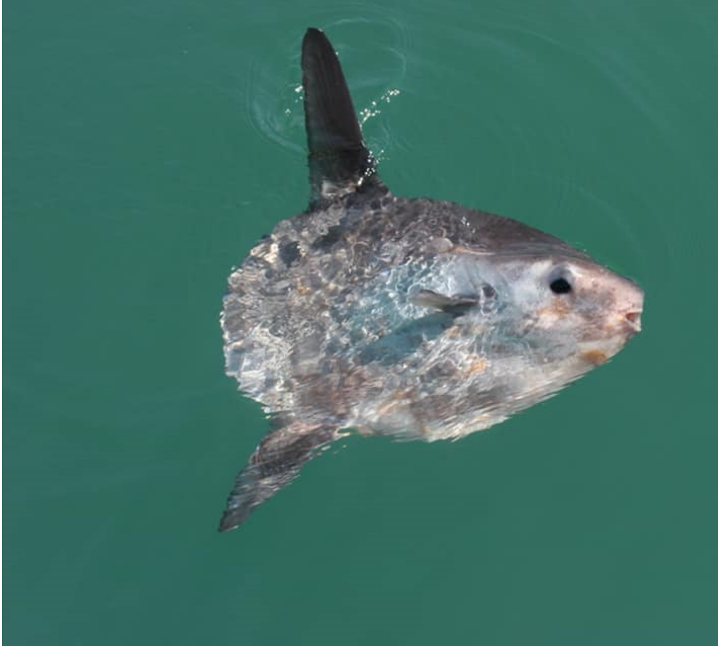
Pysgodyn yr Haul

Pysgodyn yr Haul yw pysgodyn bonedd mwyaf y byd, gan gyrraedd hyd at dri metr o hyd. Gellir eu gweld yn ystod misoedd yr haf yn 'torheulo' ar wyneb y môr.