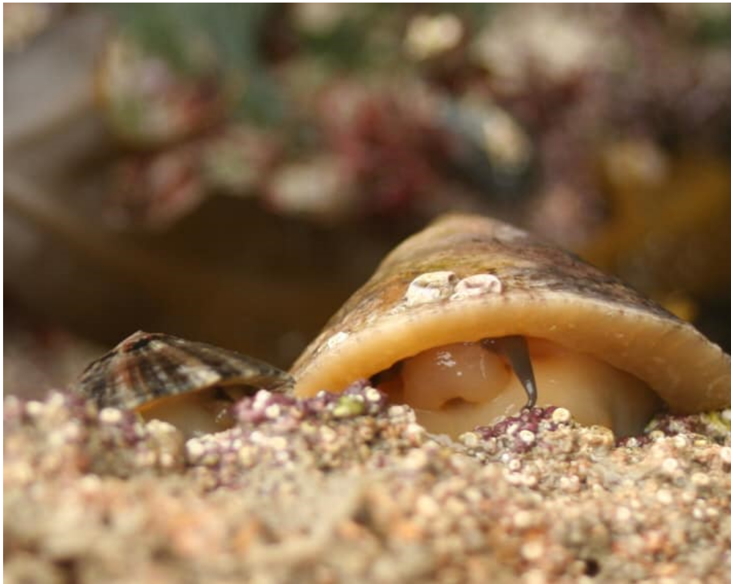
Brennig a molysgiaid eraill.