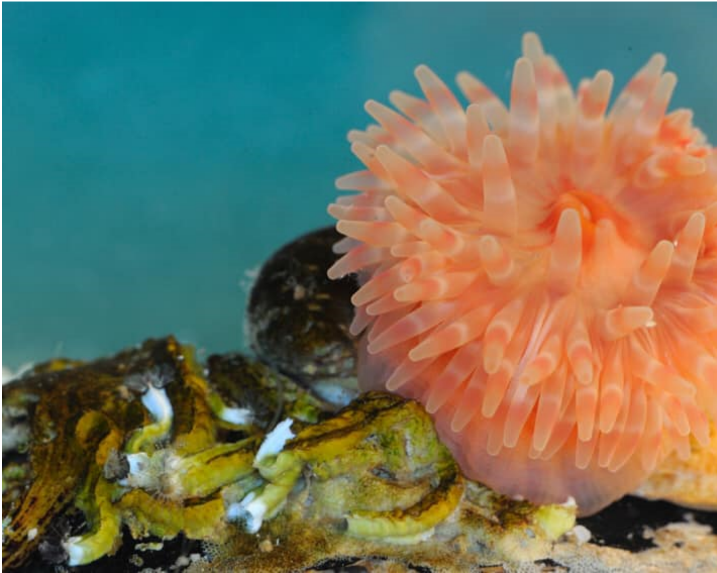
Anemoni'r Môr.