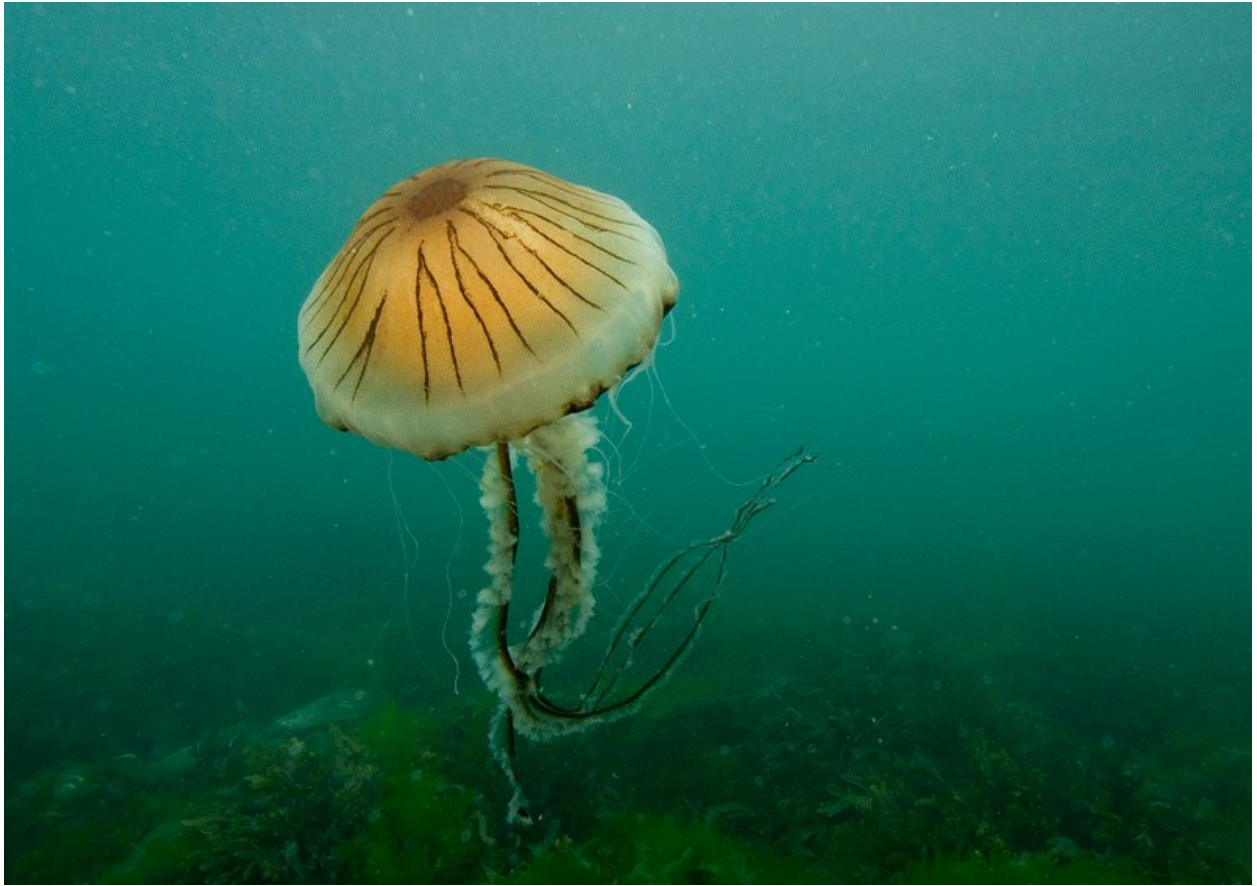
Sglefren Fôr Ddanhadlen.