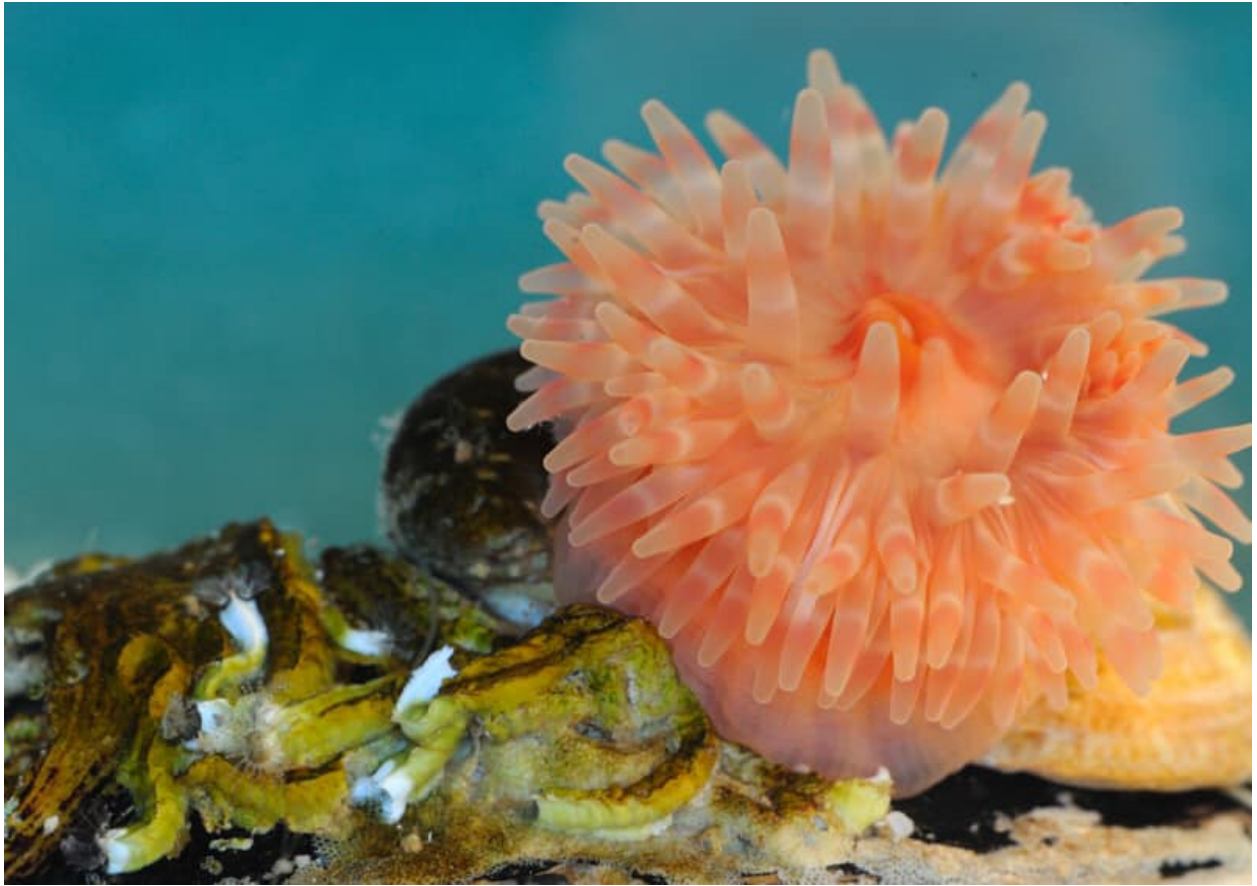
Anemoni'r Môr.