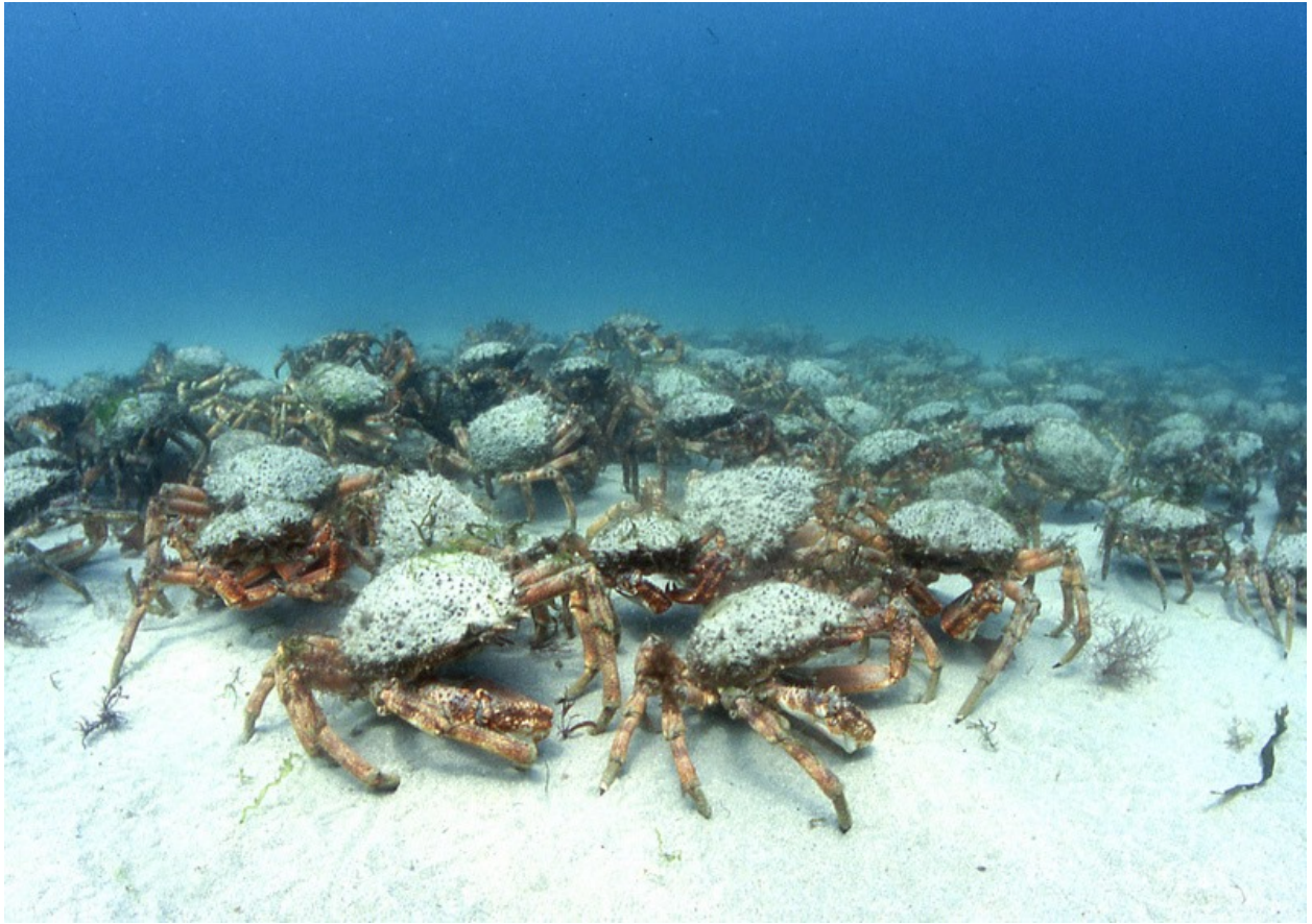
Crancod heglog.