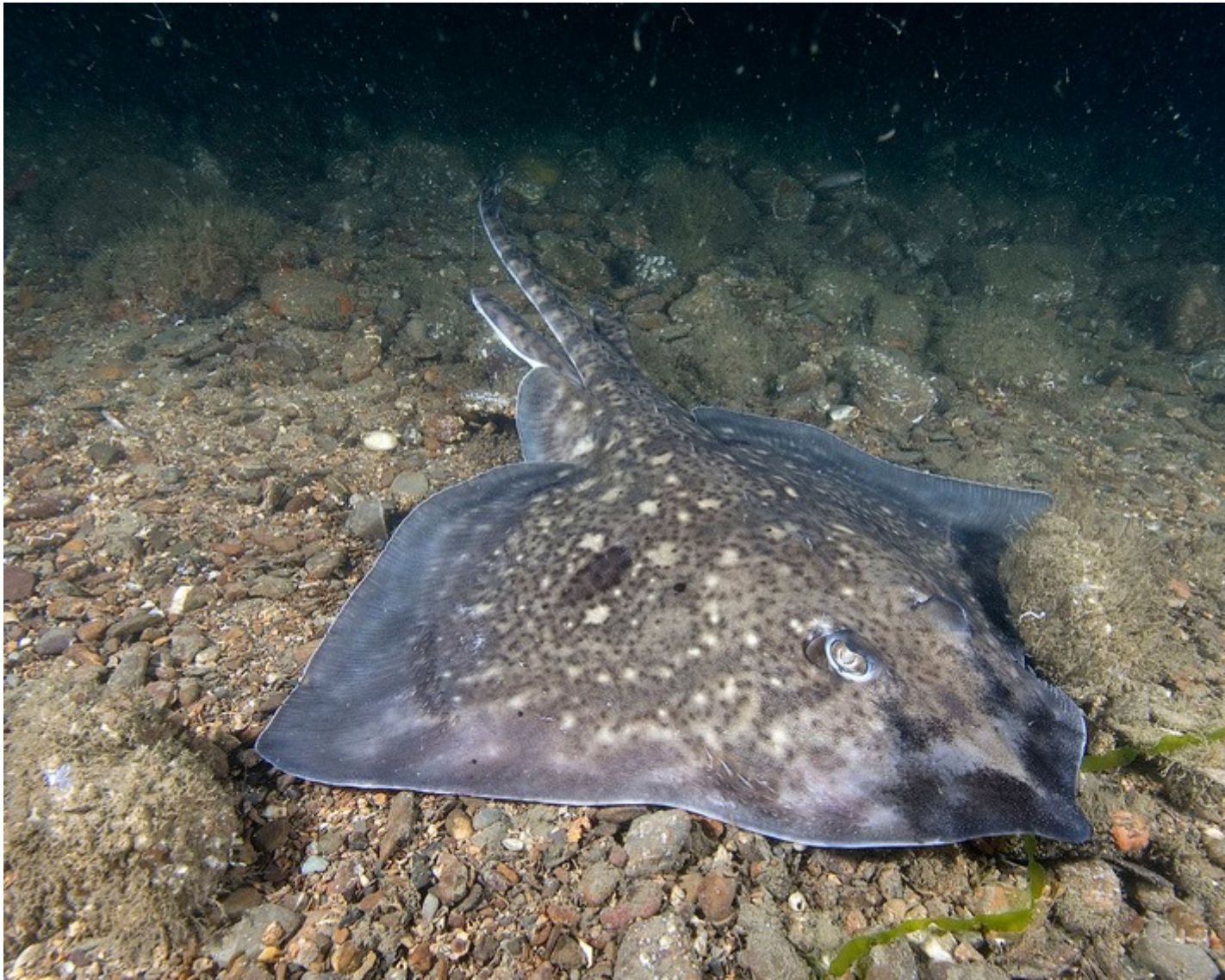
Thornback Ray.